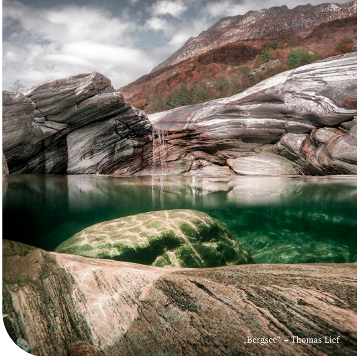
„Bergsee“ – Thomas Lief