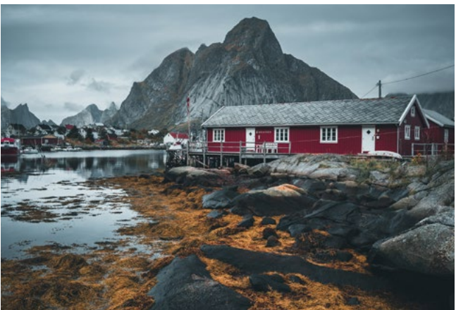
„Norwegen“ von Rebekka Bohley

Wir freuen uns, Sie bei der Vernissage dieser Ausstellung in unserem Haus begrüßen zu dürfen.