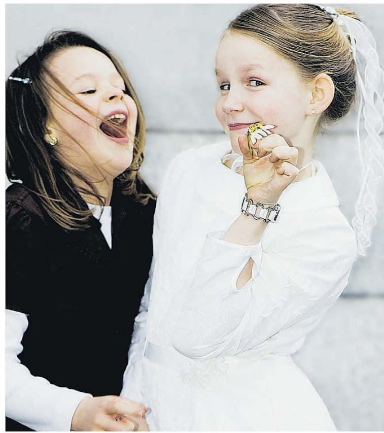
„Albern“ heißt dieses preisgekrönte Foto von Peter Stollmann.