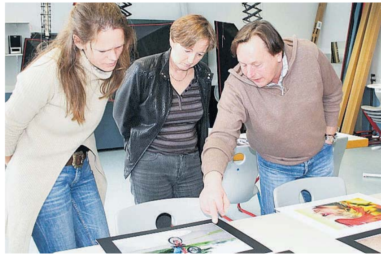
Die Jury bewertet die zahlreichen eingereichten Bilder.

lung, Aktionen und Aktivitäten rund um die Fotoausstellung, Abwicklung der Jurierung mit spezieller Erfassung und Kontrolle der Bewertungsdaten, um jede Möglichkeit von Fehlern oder gar Manipulationen auszuschließen; Auslage und Jurierung der Fotos in den Räumlichkeiten der ehemaligen erweiterten Realschule in der Heidestraße in Freisen.