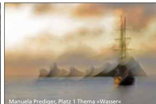
Manuela Prediger, Platz 1 Thema »Wasser«