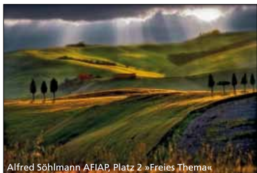
Alfred Söhlmann AFIAP, Platz 2 »Freies Thema«