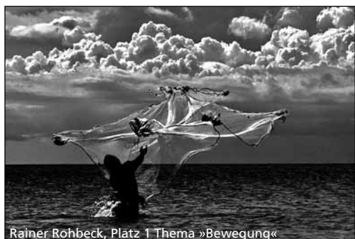
Rainer Rohbeck, Platz 1 Thema »Bewegung«